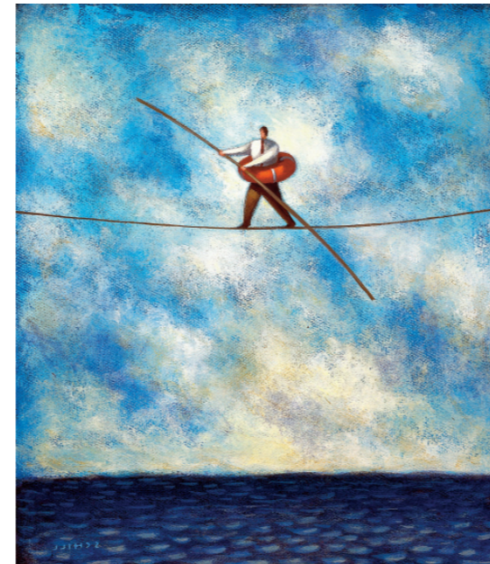
ILL: George Schill. Images.com/Corbis

En människa som behöver psykoterapi både vill och inte vill ha hjälp. Kanske väljer man då i stället motsatt strategi och ber om hjälp i alla lägen. Det leder heller inte till en optimal resa genom tillvaron. Man kan uppfattas som lat eller osjälvständig eller båda delarna, mer eller mindre med rätta. Det är därför klokt att investera sin självkänsla i att göra en saklig bedömning av sin egen kapacitet och förmåga att tänja sig, klara av det som ligger inom räckhåll och be om hjälp med resten. Den balansen kan man använda hela sitt liv till att förfina.